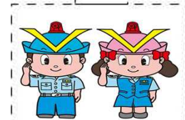
フーくん・ケイちゃん